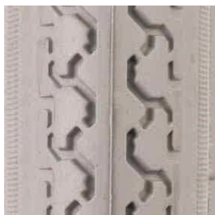
Opona do wózka inwalidzkiego rozmiar profil: kostka