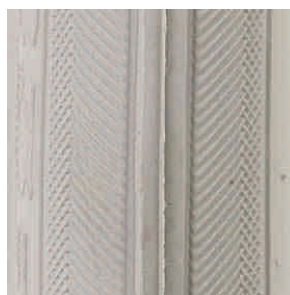
Opona do wózka inwalidzkiego ręcznego profil: jodetka

rozmiary: - 6 x 1 1/4 - 8 x 2 (200x50 mm) - 10 x 2 - 8 x 1 1/4 - 7 x 1 1/3