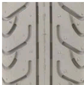
Opona do wózka inwalidzkiego elektrycznego profil: V

rozmiary: - 4.00-5 - 12 1/2 x 2 1/4 - 3.00 - 4 - 3.00 - 8