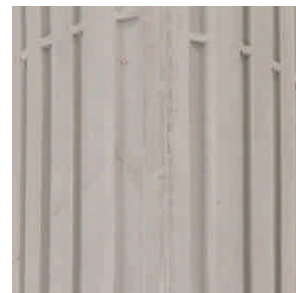
Opona do wózka inwalidzkiego ręcznego profil: rowki wzdłużne

rozmiary: - 3.00 - 4 - 3.00 - 8 - 4.10 / 3.50-6