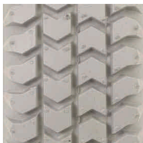
Opona do wózka inwalidzkiego elektrycznego profil: kostka

rozmiary: - 4.00-5 - 12 1/2 x 2 1/4 - 3.00 - 4 - 3.00 - 8