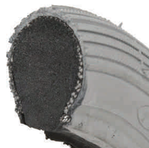
Opona poliuretanowa pełna do wózka inwalidzkiego