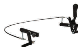
hamulec jednostronny (hamujesz oba koła z jednej strony)