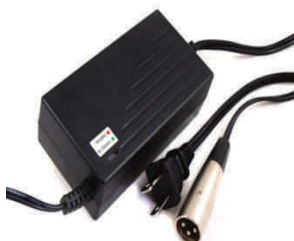
ładowarka do wózka elektrycznego (4 Amp. i 8 Amp.)