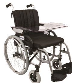
transparentny stół uniwersalny, dostępny w 3 rozmiarach: dla wózka inwalidzkiego w rozmiarze szerokość siedziska : 36 – 43 cm, 44 – 49 cm, 50 – 59 cm