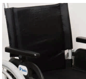
tapicerka siedziska i oparcia