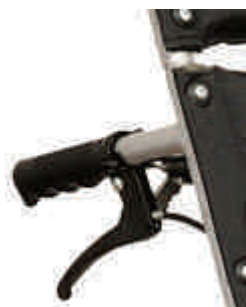
hamulce dla osoby prowadzącej