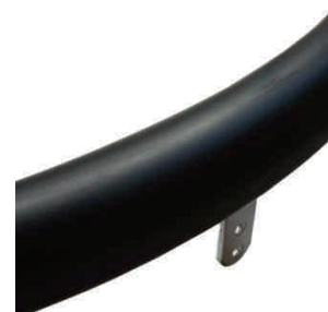
nakładki silikonowe na ciągi