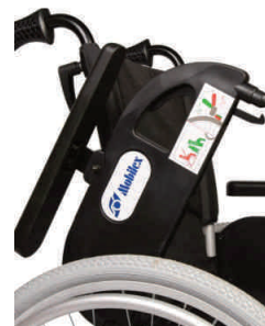
podłokietnik z boczkiem