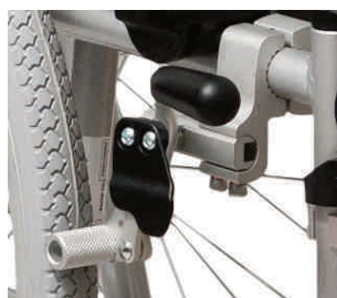
hamulce do wózków inwalidzkich