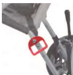
zestaw haków mocujących