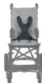
kamizelka typu H