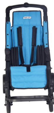
boczki zmniejszające szerokość