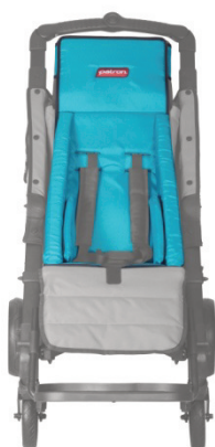
wkładka zmniejszająca rozmiar