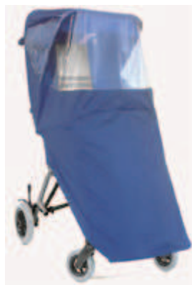
825 osłona przeciwdeszczowa