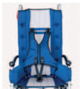
903 kamizelka pełna