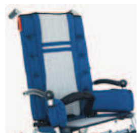
894 pas biodrowy