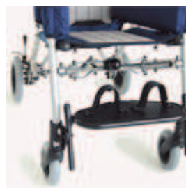
827 mocowanie stóp