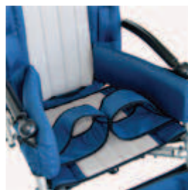
817 pasy odwodzące