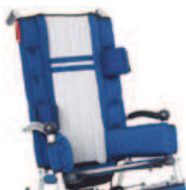
816 podpory boczne