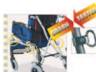
891 mocowanie do transportu