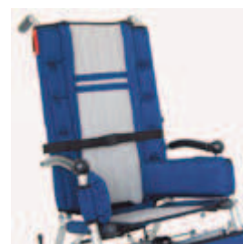
828 pas piersiowy