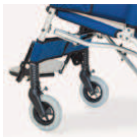
812 blokady kierunkowe kół