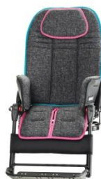
ciemno szary z różowym