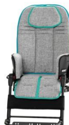
jasno szary z zielonym