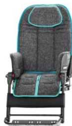
ciemno szary z zielonym