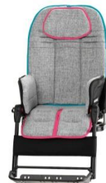
jasno szary z różowym