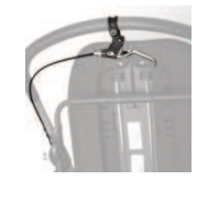
905 hamulec ręczny