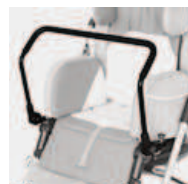
839 przednia rączka