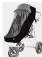
825 ostona przeciwdeszczowa