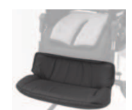
892 tapicerowana nakładka na podnóżek