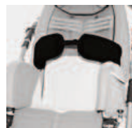
868 obejma piersiowa