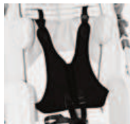
903 kamizelka 5- punktowa