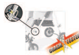
891 mocowanie do transportu