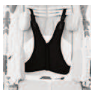
853 kamizelka pełna