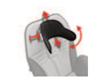
942 ergonomiczny zagłówek