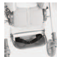
827 mocowanie stóp