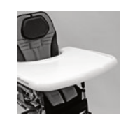
824B plastikowy stolik