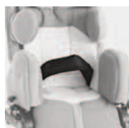
894 pas biodrowy