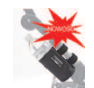
922 uchwyt na butelkę