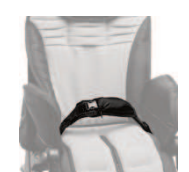
920 pas 4-punktowy