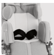
817 pas odwodzący