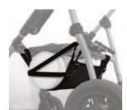
935 uchwyt na butlę z tlenem