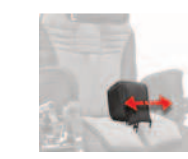
834R regulowany na głębokość klin