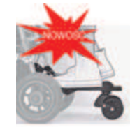
921 podpórka dla drugiego dziecka