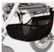
858 koszyk tekstylny