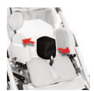
834 regulowany tapicerowany klin