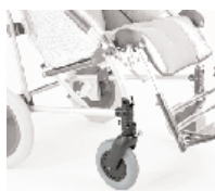
812 blokady kierunkowe kół