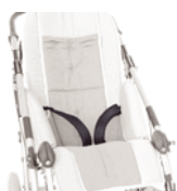
817 pasy odwodzące