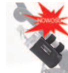
922 uchwyt na butelkę