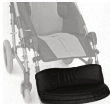
892 tapicerowana nakładka na podnóżek