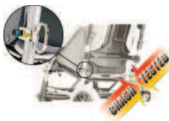
891 mocowanie do transportu