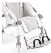
827 mocowanie stóp