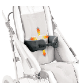
868 obejmia piersiowa