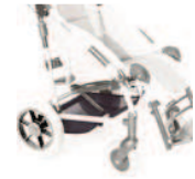
858 koszyk tekstylny