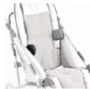
838 podpory boczne