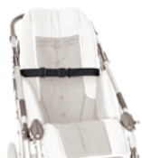
828 pas piersiowy