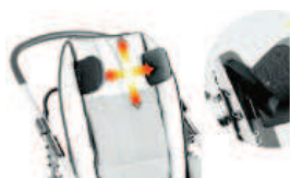
863 zagłówek regulowany