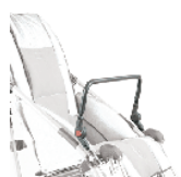
839 przednia rączka