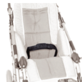
894 pas biodrowy