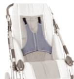
853 kamizelka pełna