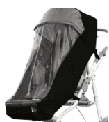
825 osłona przeciwdeszczowa