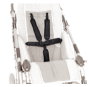
906 pas 5-punktowy