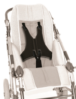
903 kamizelka 5-punktowa