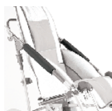
844 osłona ramy