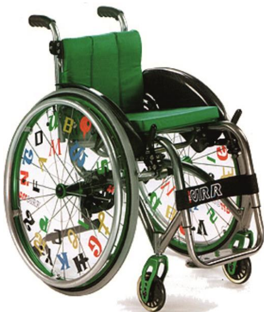
wersja dla dzieci