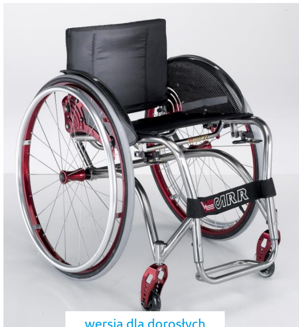
wersja dla dorosłych