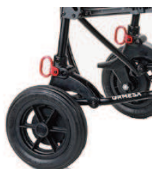
891 Mocowania do transportu (4 punkty)