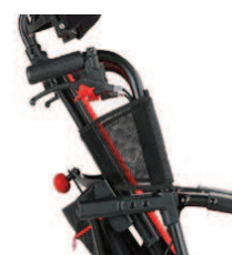
844 Pokrowiec na podpory boczne