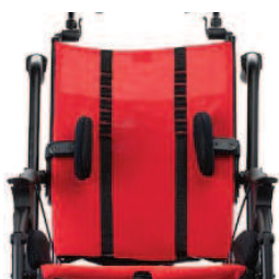
838 Podpory boczne, regulowane na wysokość