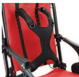
853 SLIM Kamizelka