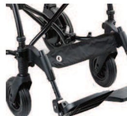
956 Regulowany podnóżek ( TILT)