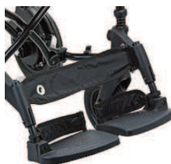
960 Zapiętki (para)