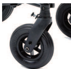
812 Błokady kierunkowe kół przednich