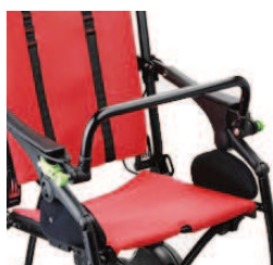
839 Przednia rączka