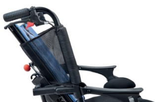
844 Pokrowiec na podpory boczne