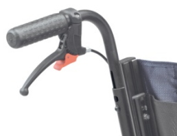
951 Rączki regulowane na wysokość