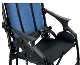
920 Pas 4 punktowy