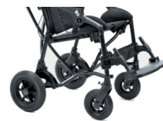
812 Błokady kierunkowe kół przednich