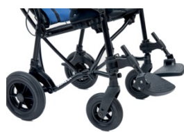
956 Regulowany podnóżek (TILT)