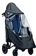
825 Ostrona przeciwdeszczowa tylko z daszkiem