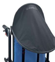
819 Unoszony daszek z torbą i okienkiem