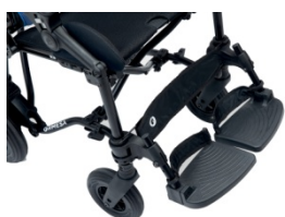
960 Zapiętki (para)