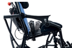
947 Pas biodrowy z ustawieniem kąta