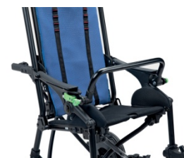
839 Przednia rączka