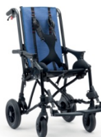
853 Slim Kamizelka