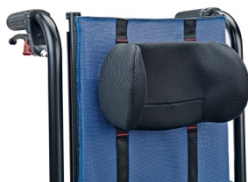
835 Zagłówek regulowany na wysokość kształt C