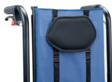
865 Zagłówek regulowany na wysokość płaski