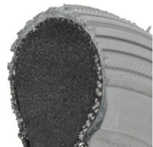
Opona poliuretanowa pełna do wózka inwalidzkiego

rozmiary: - 22" x 1" - 24" x 1" - 26" x 1"