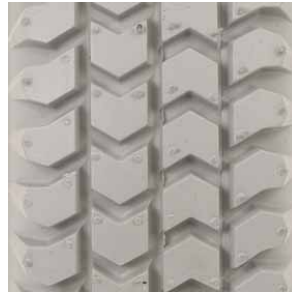
Opona do wózka inwalidzkiego elektrycznego profil: kostka

rozmiary: - 4.00"-5" - 12 1/2" x 2 1/4" - 3.00" - 4" - 3.00" - 8"