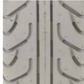
Opona do wózka inwalidzkiego elektrycznego profil: V

rozmiary: - 4.00"-5" - 12 1/2" x 2 1/4" - 3.00" - 4" - 3.00" - 8"