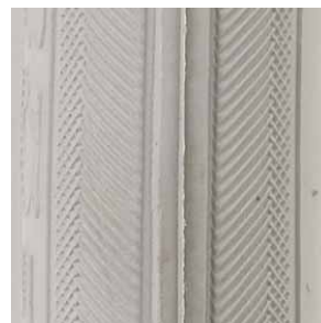
Opona do wózka inwalidzkiego ręcznego profil: jodełka

rozmiary: - 8" x 2" (200x50 mm) - 10" x 2"