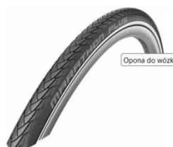
Opona do wózka inwalidzkiego Marathon Plus Evolution