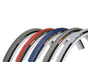
Opona do wózka inwalidzkiego ręcznego KENDA