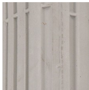
Opona do wózka inwalidzkiego elektrycznego profil: rowki wzdużne

rozmiary: - 8" x 2" (200x50 mm) - 10" x 2"