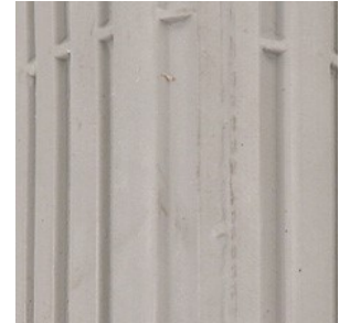
Opona do wózka inwalidzkiego ręcznego profil: rowki wzdużne

rozmiary: - 3.00" - 4" - 3.00" - 8" - 4.10" / 3.50-6"